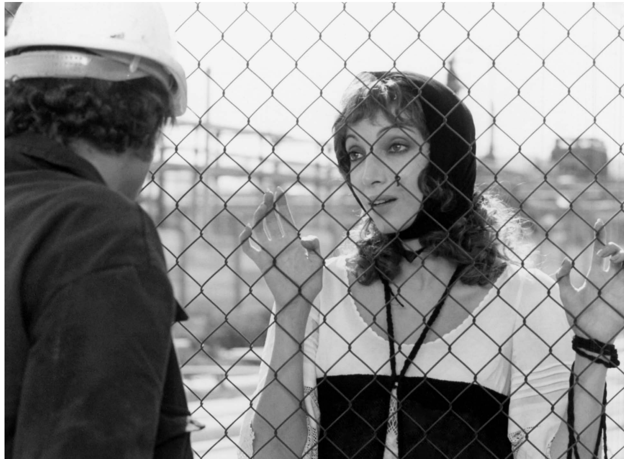
MIMI METALLURGICO FERITO NELL'ONORE / S.13