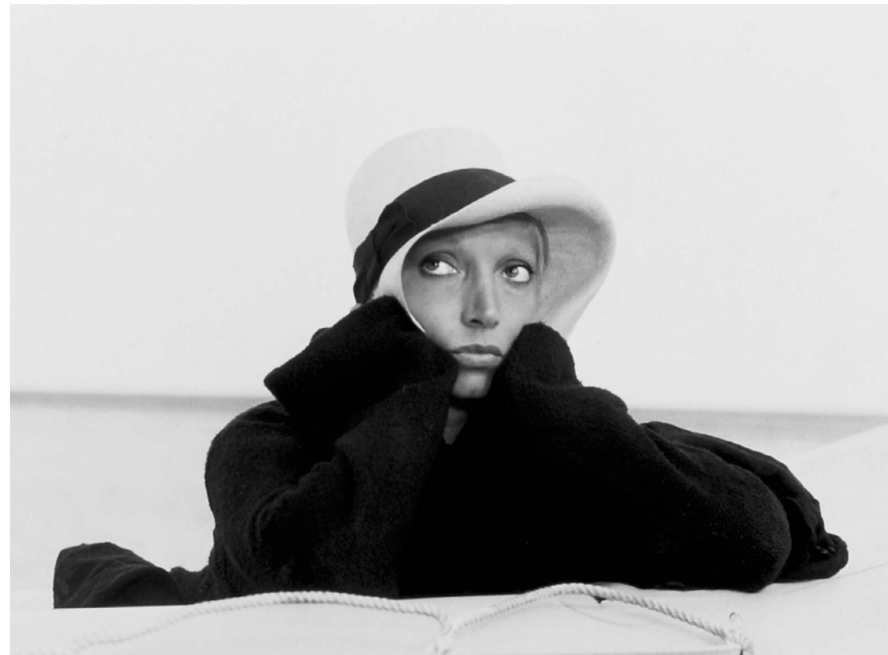
TRAVOLTI DA UN INSOLITO DESTINO NELL'AZZURRO MARE D'AGOSTO / S.13

20:00 BRAD PITT S.18 Frankreich/USA/Mexiko 2006 144 Min. Farbe. 35 mm. E/d/f ALEJANDRO GONZÁLEZ INÁRRITU