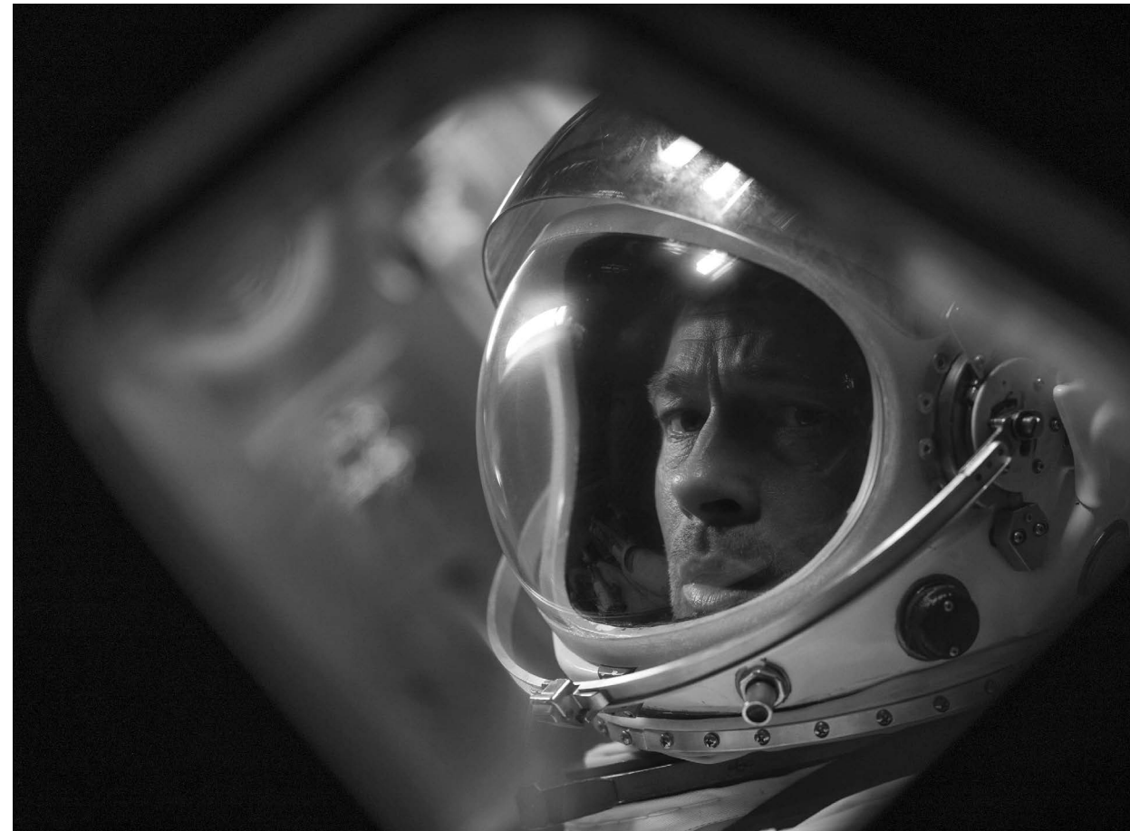
AD ASTRA / S.19