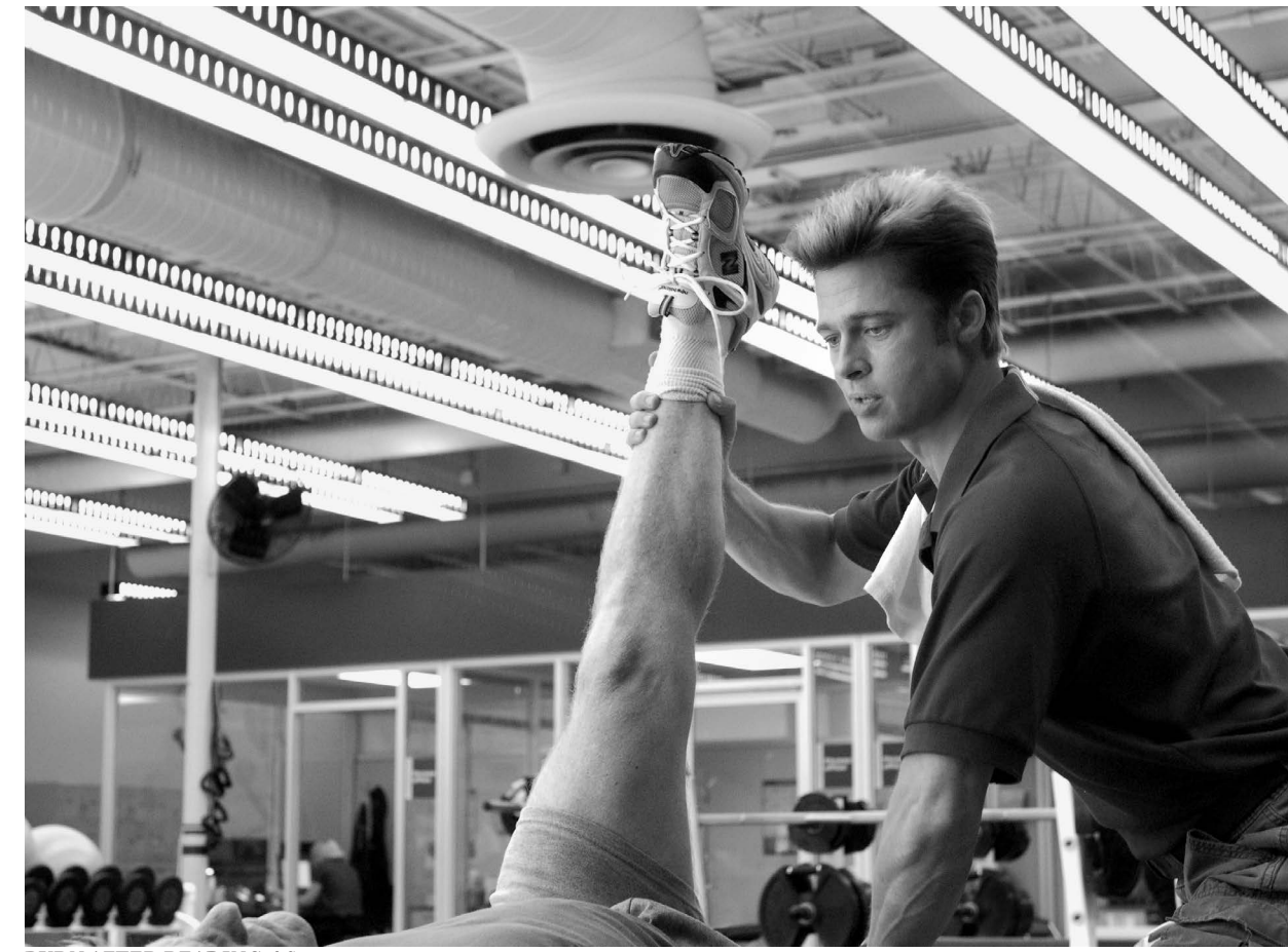
BURN AFTER READING / S.19