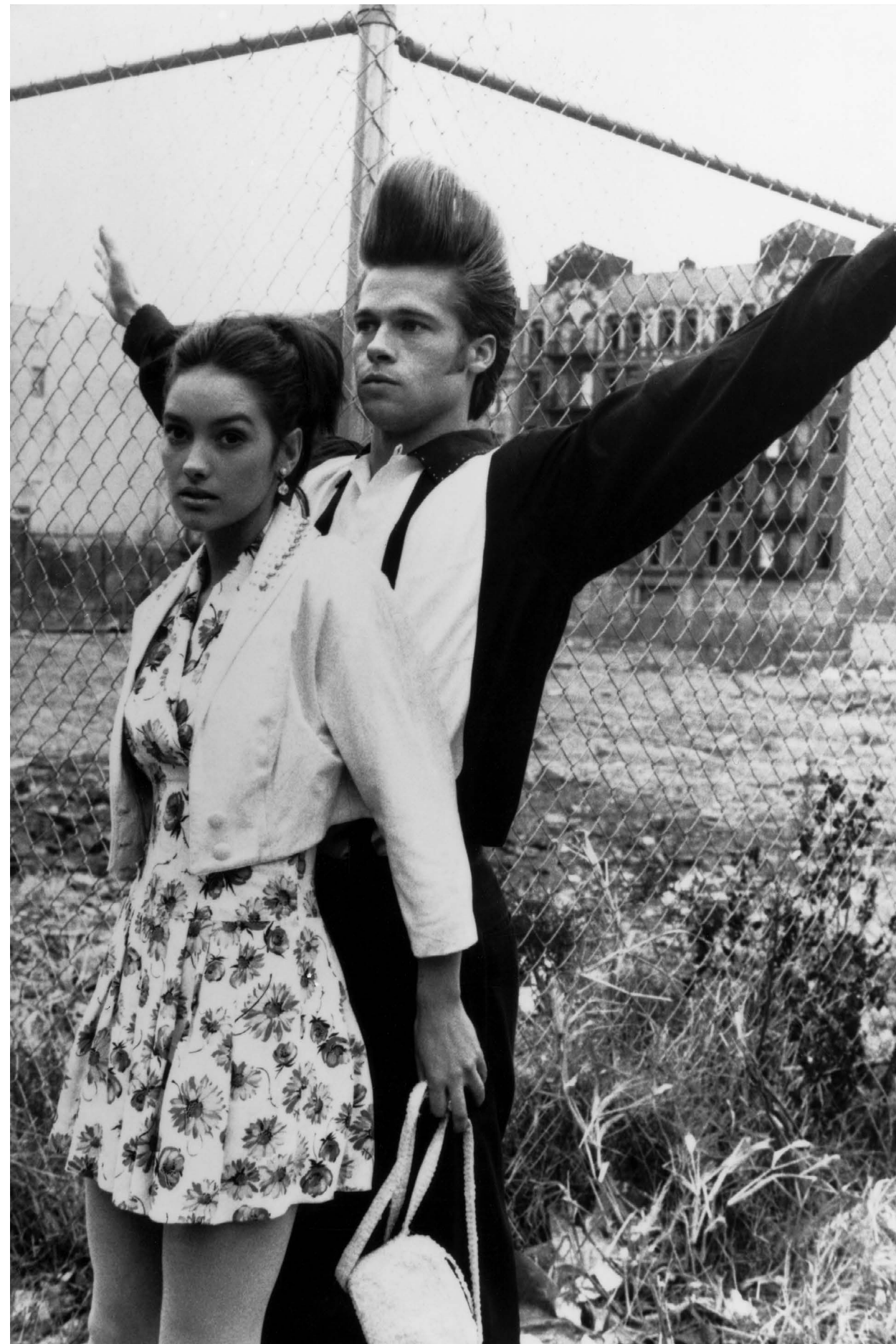
JOHNNY SUEDE / S.17