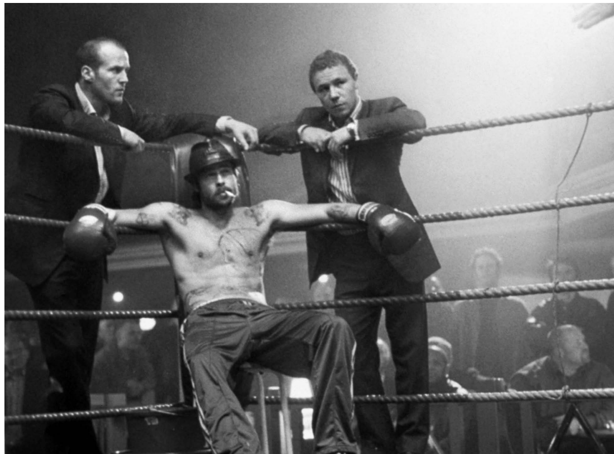
SNATCH / S.18

20:15 BRAD PITT THE TREE OF LIFE S.22 USA 2011 138 Min. Farbe. 35 mm. E/d/f TERRENCE MALICK