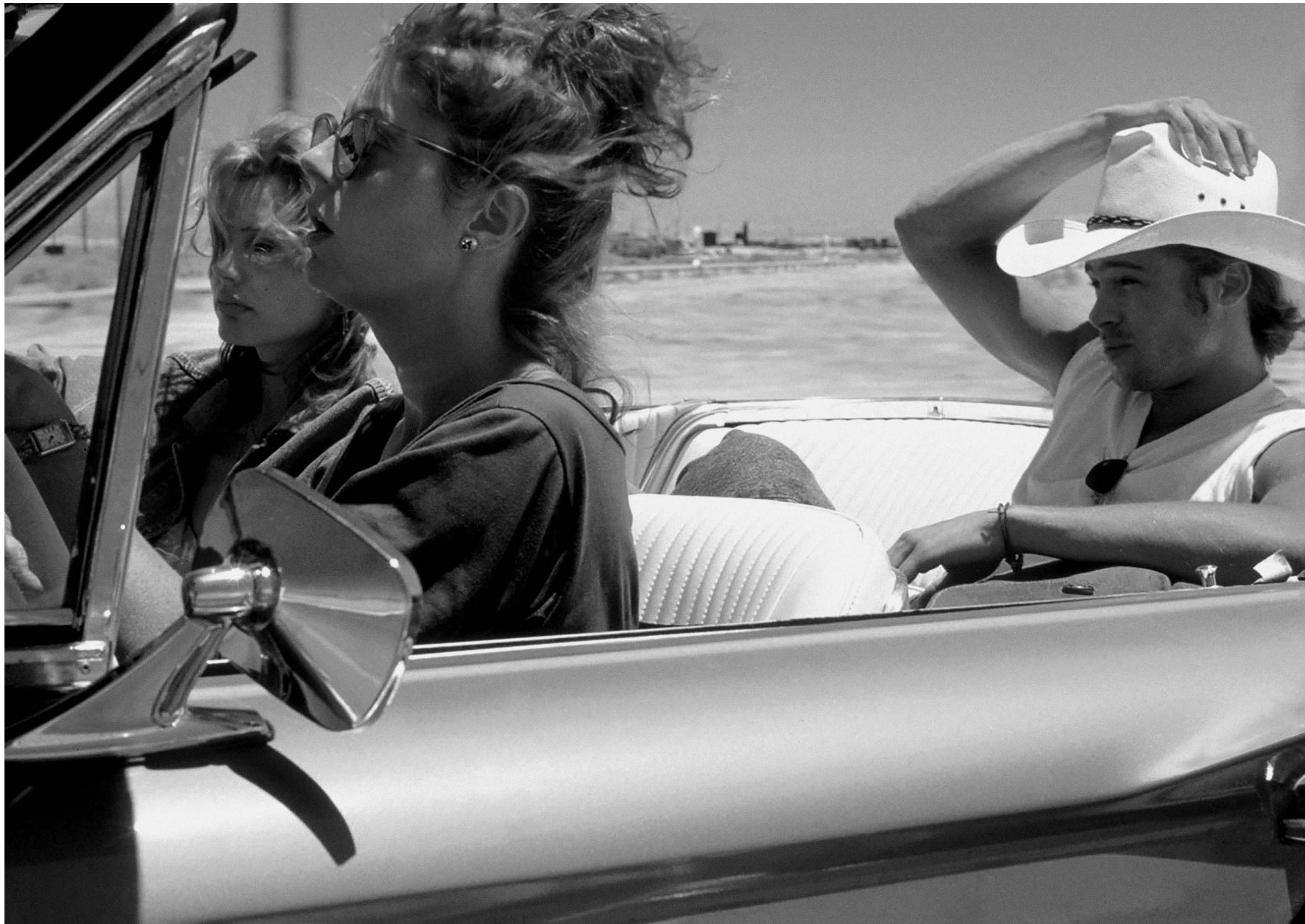
THELMA & LOUISE / S.17

LANDKINO IM SPUTNIK 20:15 A RIVER RUNS THROUGH IT S.22 USA 1992 124 Min. Farbe. DCP. E/d ROBERT REDFORD