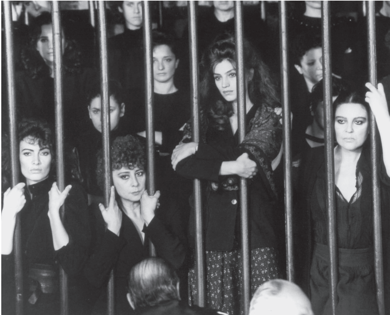
UN COMPLICATO INTRIGO DI DONNE, VICOLI E DELITTI / S.14

S.22 BRAD PITT | LINA WERTMÜLLER | PREMIERE