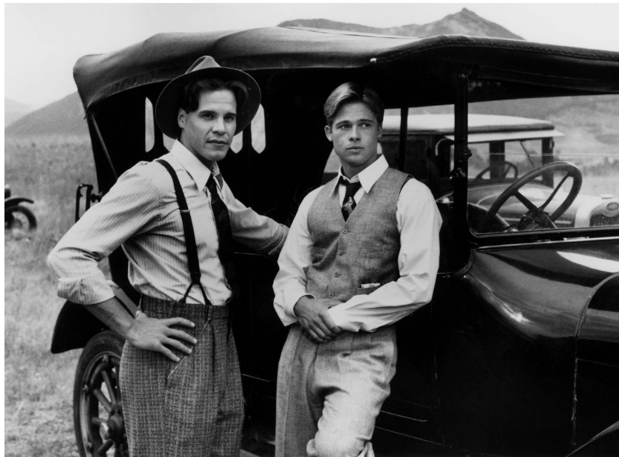
A RIVER RUNS THROUGH IT / S.17

S.22 Schweiz/Kanada 2018 78 Min. Farbe. DCP. F/d NICOLAS WADIMOFF