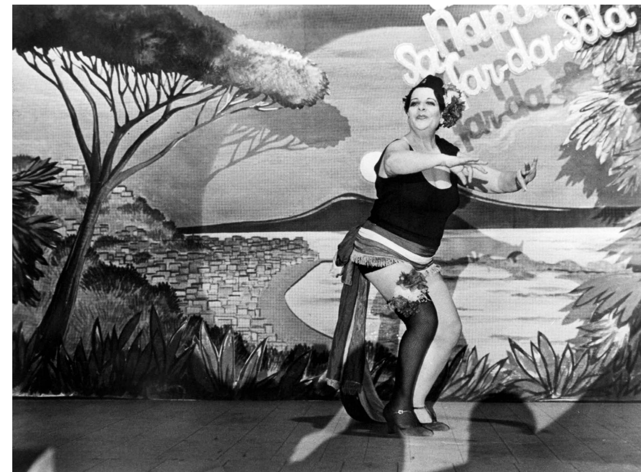
PASQUALINO SETTEBELLEZZE / S.14

FREITAG 16:15 BRAD PITT 12 MONKEYS S.17 USA 1995 129 Min. Farbe. DCP. E/d TERRY GILLIAM