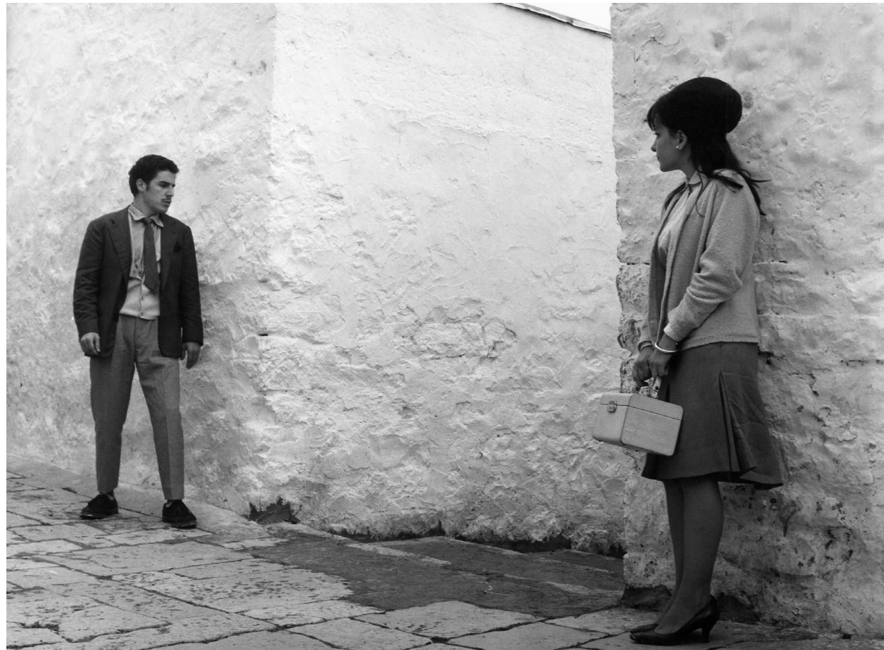
I BASILISCHI / S.12